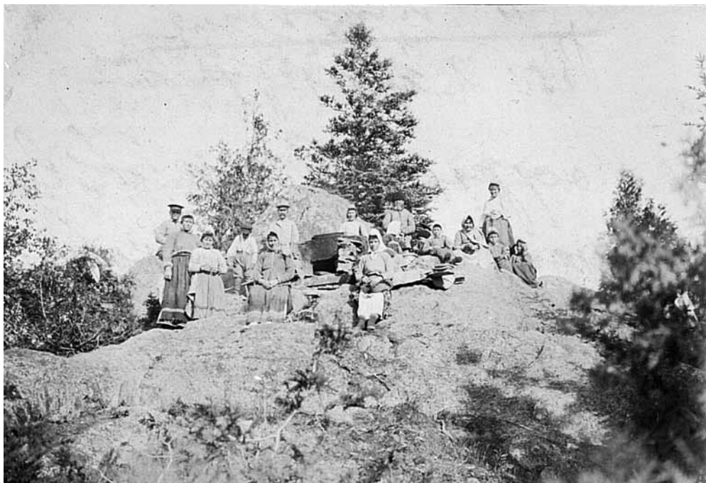
Рис. 4. Самодельная печка. Фотоотпечаток. Канада. Русские. 1899 г. МАЭ № 1692-7