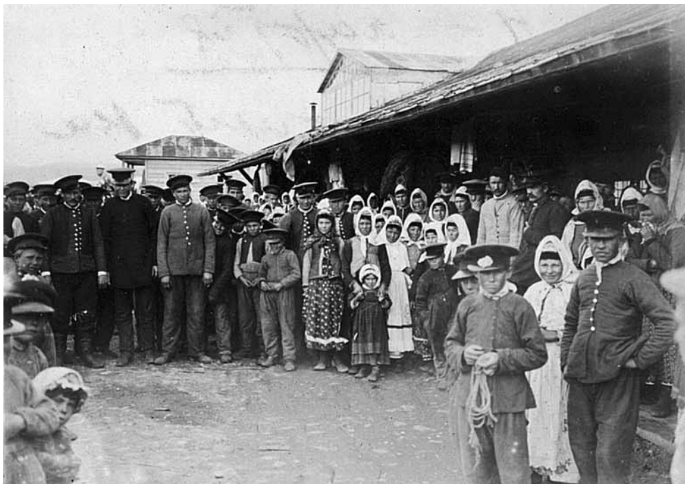
Рис. 2. У барачков в Батуми. Фотоотпечаток. Грузия. Русские. 1899 г. МАЭ № 1692-2