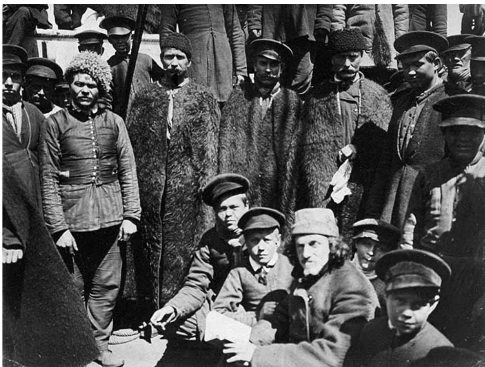
Рис. 3. Группа духоборов на корабле "Lake Huron". Фотоотпечаток. Русские. 1899 г. МАЭ № 1692-12