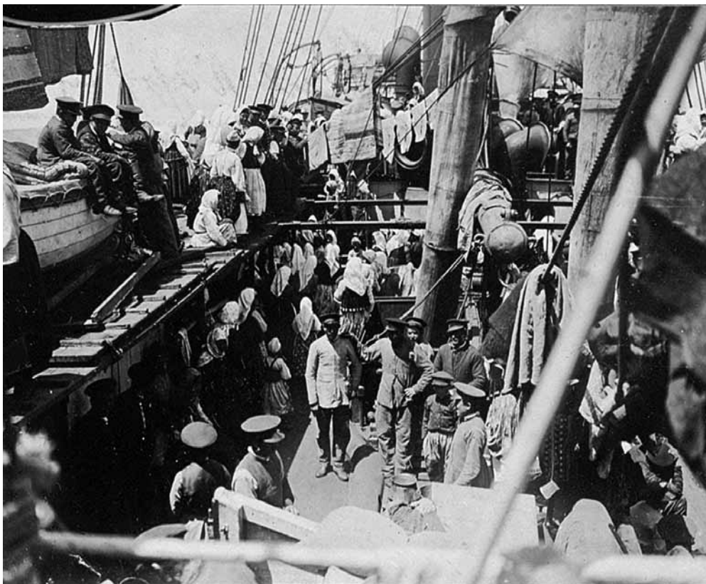
Рис. 1. Группа духоборов на корабле «Lake Huron». Фотоотпечаток. Русские. 1899 г. МАЭ № 1692-14