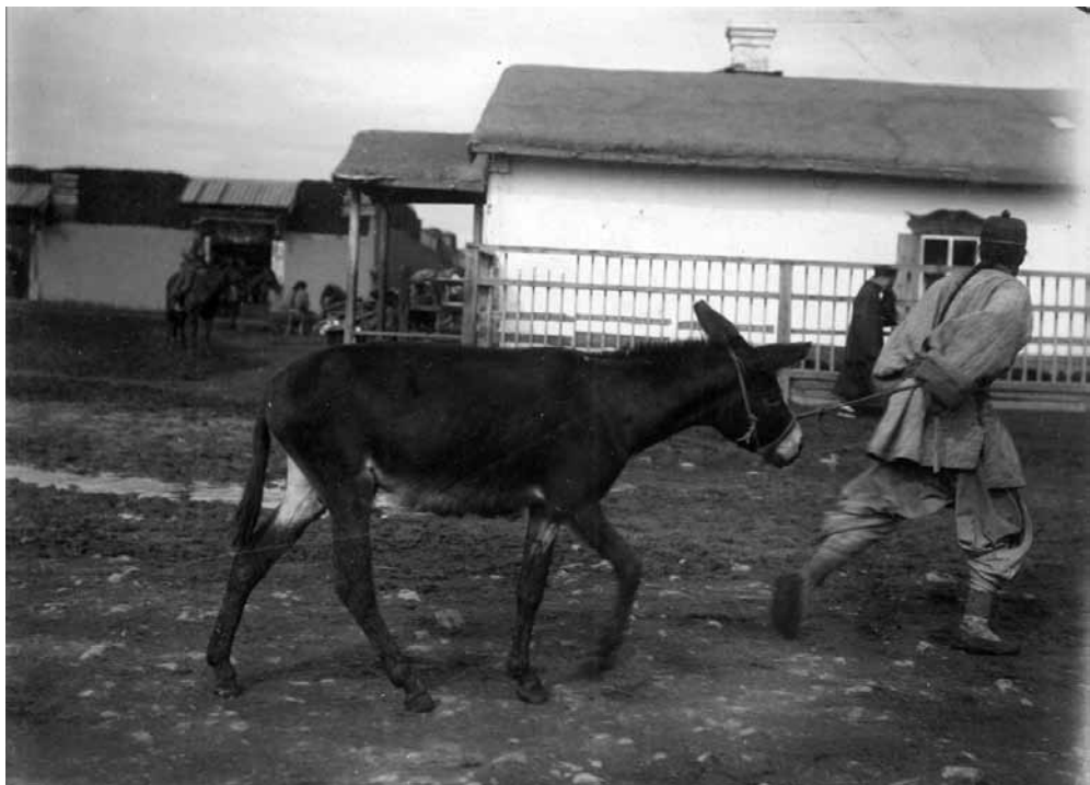
Рис. 16. Вид Ургинского Маймачена. Китаец с осликом. Монголы. Монголия. А. А. Лушников, И. А. Лушников (?). 1899 г. МАЭ № 1368-70