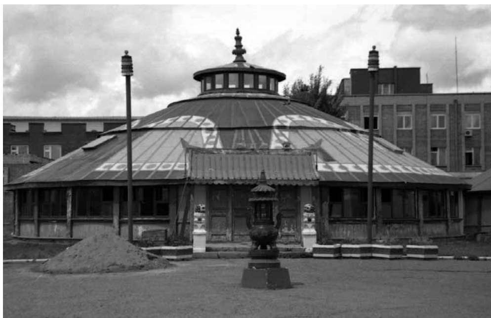
Рис. 4. Юртообразный храм в монастыре Дашчойлинг. Монголы. Монголия. Д. В. Иванов. 2006 г.