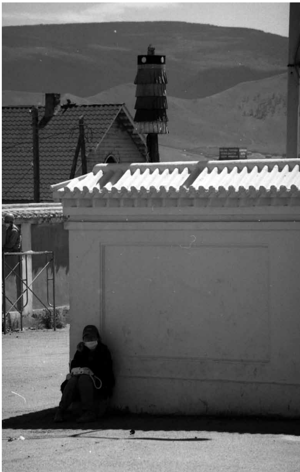
Рис. 9. Человек-телефон-автомат. Монголы. Монголия. Д. В. Иванов. 2006 г.