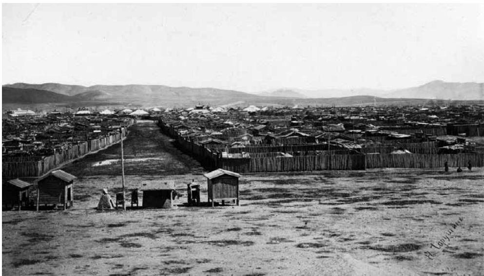
Рис. 1. Вид Урги. Монголы. Монголия. Н. А. Чарушин. 1888 г. МАЭ № 1697-153