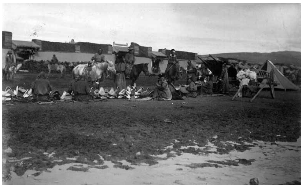
Рис. 13. Торговля седлами на ургинском базаре. На заднем плане видны дрова, лежащие поверх стен. Монголы. Монголия. А. А. Лушников, И. А. Лушников (?). 1899 г. МАЭ № 1368-108