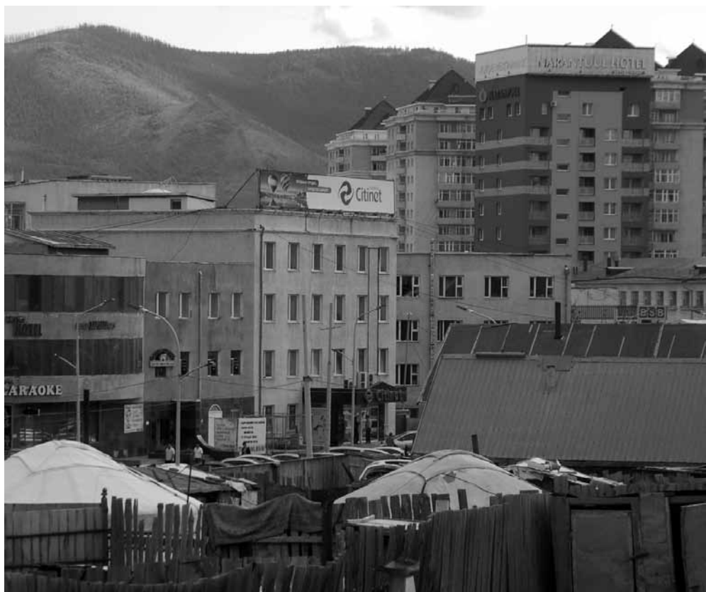
Рис. 12. Окрестности монастыря Гандан. Монголы. Монголия. Д. В. Иванов. 2017 г.