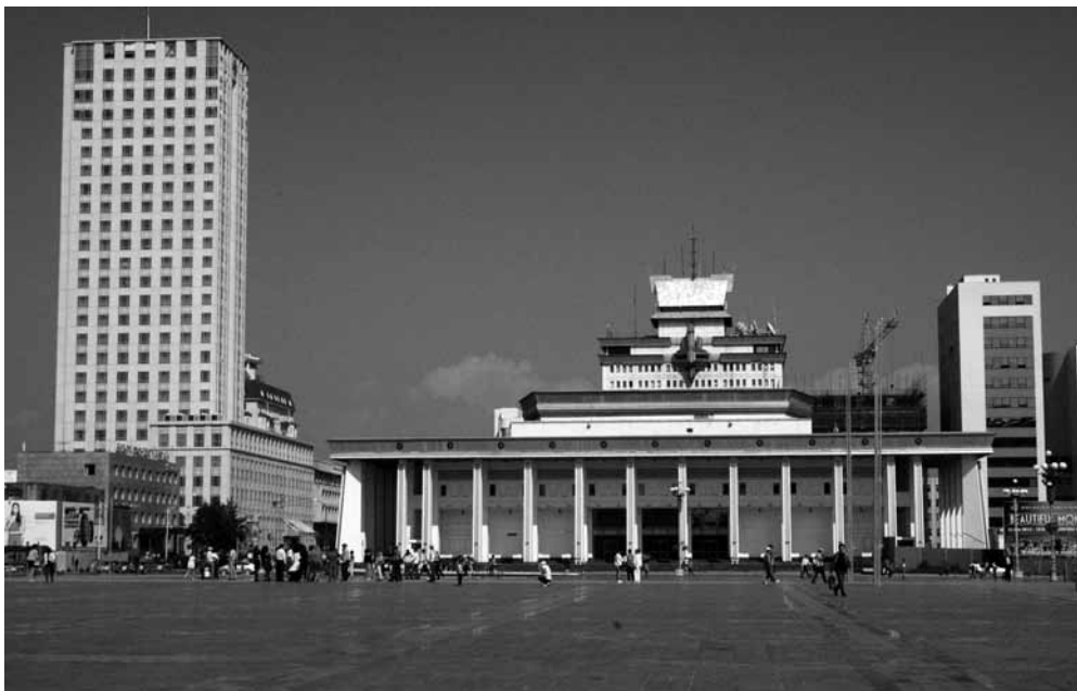
Рис. 8. Дворец культуры в Улан-Баторе. Монголы. Монголия. Д. В. Иванов. 2013 г.

Гандан оставался действующим монастырем практически на протяжении всего советского времени с кратким перерывом в 1938–1944 гг. Гандан и его окрестности с жилыми юртами 3 , стоящими за деревянными заборами (рис. 11, 12), наиболее полно сохранили облик города конца XIX — начала XX в.