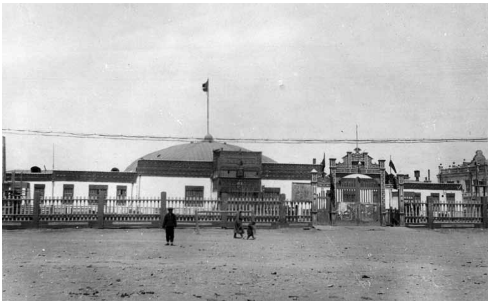
Рис. 5. Здание Национального театра в Улан-Баторе. Монголы. Монголия. Монгольский ученый комитет. 1940 г. МАЭ И 1037-140

На месте Желтого дворца сначала построили первый в Монголии Национальный театр (рис. 5), сгоревший в 1948 г. После пожара там возвели здание ЦК Монгольской народно-революционной партии и правительства (Ломакина 1977: 103), перед которым располагался мавзолей Д. Сухэ-Батора и Х. Чойболсана, снесенный в 2005 г. В 2006 г. была закончена реконструкция Дворца правительства и центральная площадь Улан-Батора обрела современный облик. Для Государственного театра оперы и балета в 1948 г. выстроили новое здание в восточной стороне площади Сухэ-Батора (Чингисхана) (рис. 6). Рядом располагается Центральный дворец культуры. В фондах нашего музея имеется фотография Дворца культуры 1940 г. (рис. 7), но здание было перестроено в 1988 г. и в настоящее время выглядит по-другому (рис. 8).