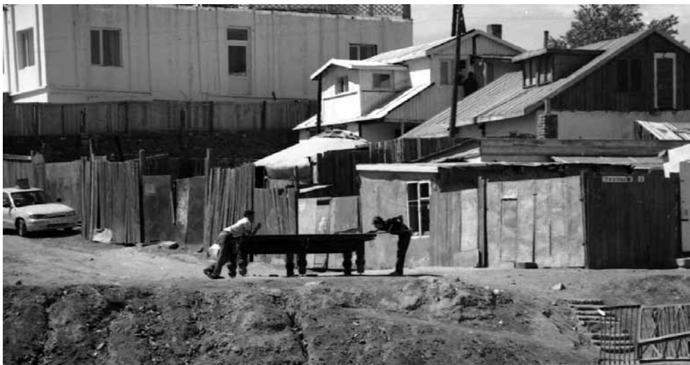
Рис. 11. Окрестности монастыря Гандан. Монголия. Д. В. Иванов. 2006 г.

плане. Из публикации А. М. Позднеева «Города Северной Монголии» мы узнаем: «...чтобы еще труднее было перелезть через заборы, богатые пристраивают к ним внутри двора навесы, а наверху этих навесов складывают дрова» (Позднеев 1880: 32) (рис. 13). Довольно много кадров Лушниковы сняли в китайском торговом квартале Урги — «Ургинском Маймачене»: «починка колеса»; «подковка лошади»; «китаец с осликом»; «монголка на лошади перед