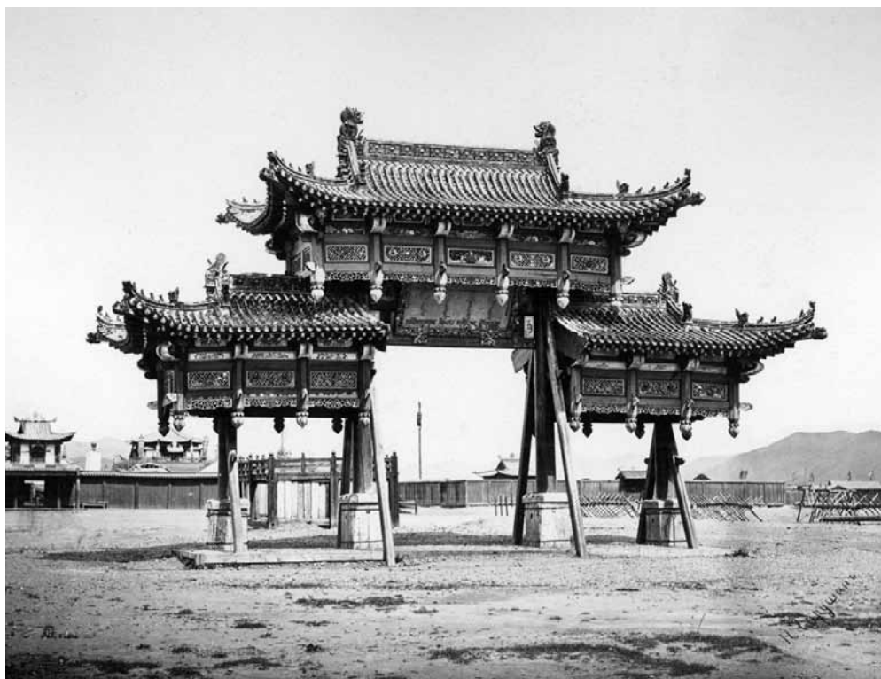
Рис. 3. Ворота «Ямпай» на площади перед желтым дворцом Богдо-гэгэна. Монголы. Монголия. Н. А. Чарушин. 1888 г. МАЭ № 1697-156