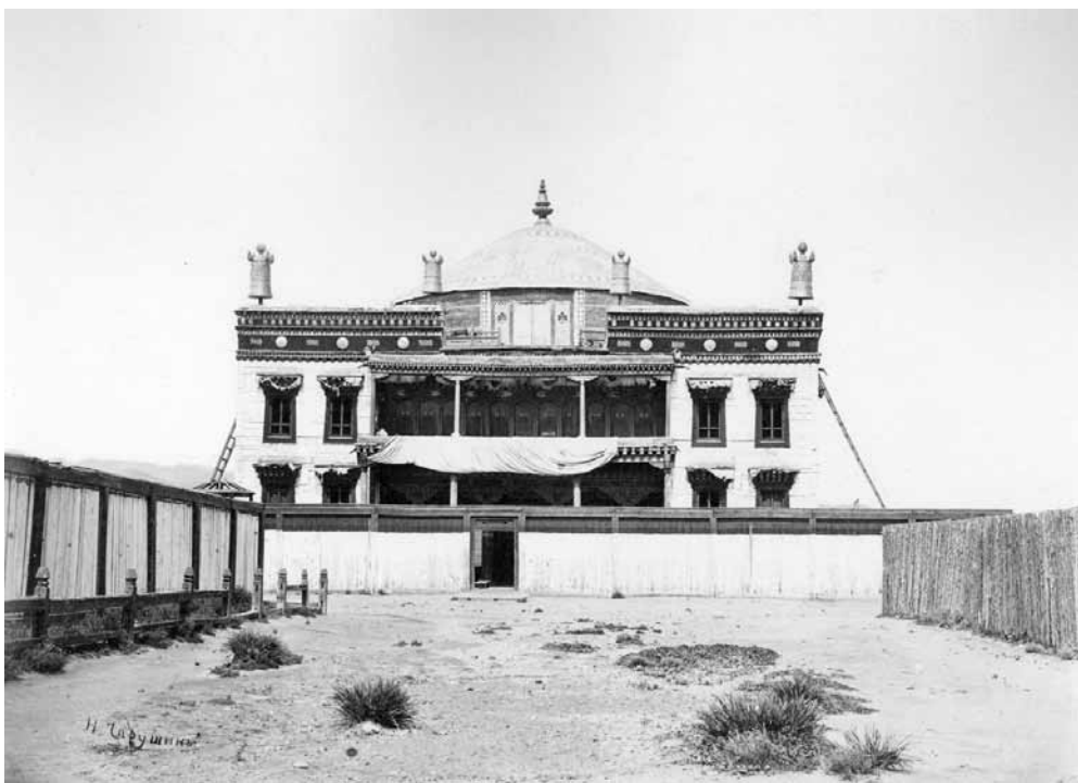
Рис. 2. Вид храма Майдари. Монголы. Монголия. Н. А. Чарушин. 1888 г. МАЭ № 1697-177

и храмов, был уничтожен. В наши дни преемником религиозной жизни этого квартала является монастырь Дашчойлин, основанный в 90-е годы XX в. там, где располагались храмы аймаков Эрхэм и Вангай (рис. 4). В настоящее время ламы монастыря Дашчойлин планируют восстановить храм Майдари.