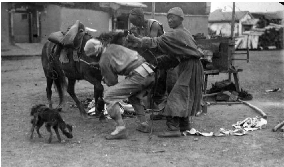
Рис. 15. Вид Ургинского Маймачена. Подковка лошади. Монголы. Монголия. А. А. Лушников, И. А. Лушников (?). 1899 г. МАЭ № 1368-66

китайской лавкой» (рис. 14–17). Особую ценность этим фотографиям придает то, что они не постановочные, а, возможно, самые ранние снимки, сделанные, как говорится, «вживую» прямо на улицах Урги.