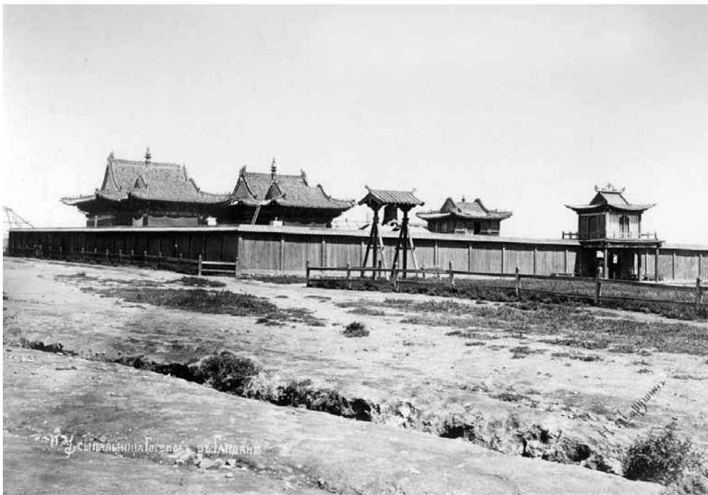
Рис. 10. Усыпальница V и VII Богдо-гэгэнов в Гандане. Монголия. Монголия. Н. А. Чарушин. 1888 г. МАЭ № 1697-167