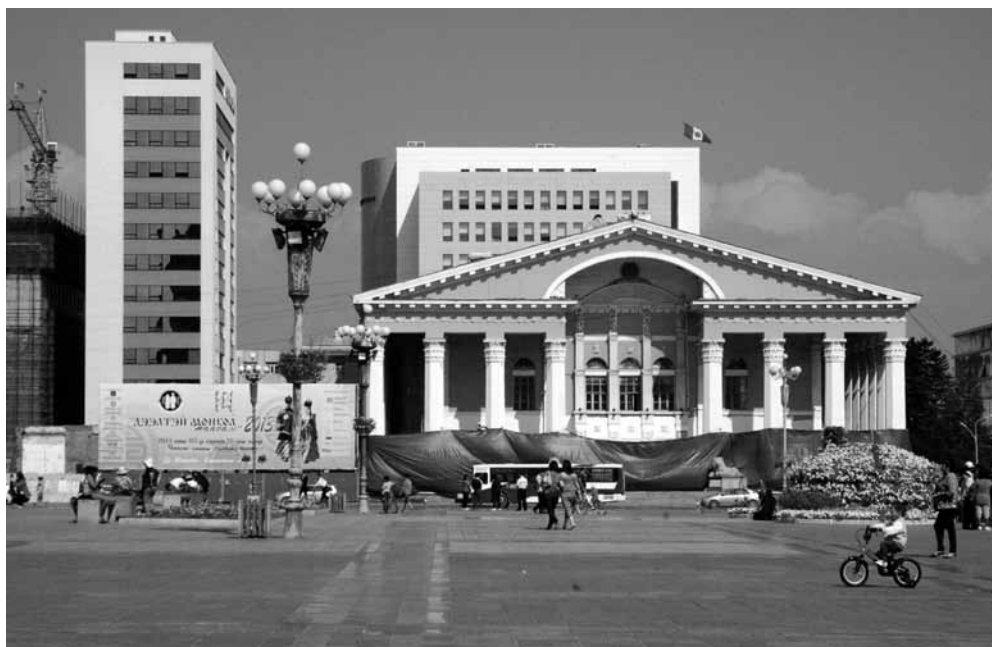
Рис. 6. Государственный театр оперы и балета. Монголы. Монголия. Д. В. Иванов. 2013 г.