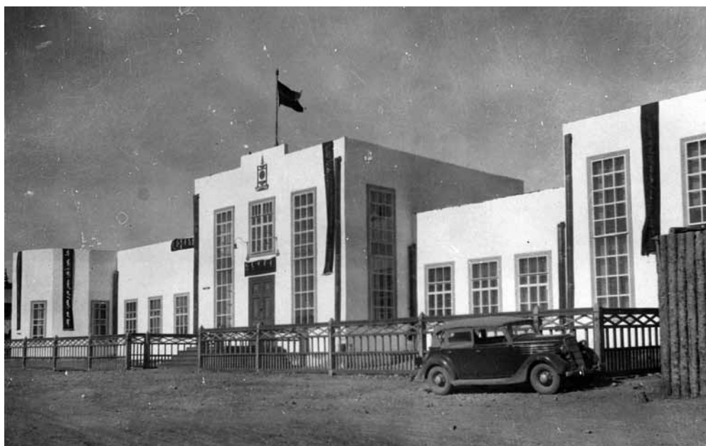
Рис. 7. Дворец культуры в Улан-Баторе. Монголы. Монголия. Монгольский ученый комитет. 1940 г. МАЭ И 1037-143

Этот крупнейший центр изучения буддийской философии в Монголии фотографировали разные путешественники и исследователи. Н. А. Чарушин сделал снимок усыпальниц V и VII Богдо-гэгэнов в Гандане (рис. 10). Именно при V Богдо-гэгэне в 1835 г. было заложено первое деревянное здание монастыря.