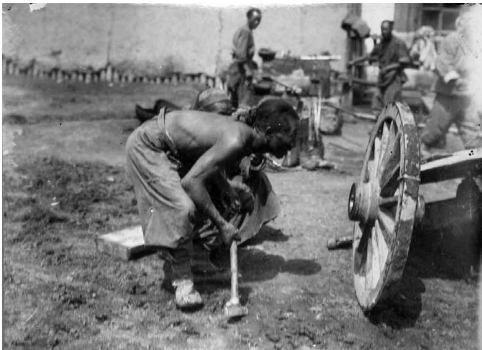
Рис. 14. Вид Ургинского Маймачена. Починка колеса. Монголы. Монголия. А. А. Лушников, И. А. Лушников (?). 1899 г. МАЭ № 1368-65